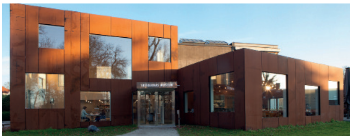
Skissernas Museum

Nu äntligen ska vår resa till Arken Museum för Modern Konst i Danmark bli av. Resan arrangeras tillsammans med vår konstförening KonstArten.