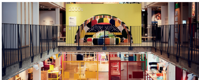
IKEA:s museum