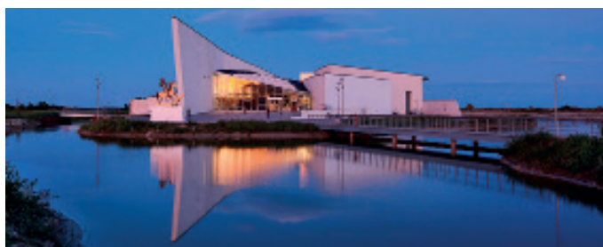
ARKEN Museum for Samtidskunst Pressebillede2